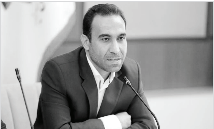
حضور وزیر کشور

هدف دفن بهداشتی، مهندسی پسماند، کنترل شیرابه و جلوگیری از آلودگی آب‌های زیر زمینی و خاک و با اعتباری بالغ بر ۷۰۰ میلیارد ریال افتتاح و به بهره‌برداری رسید.